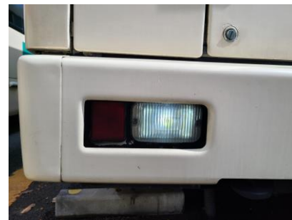
LED化したコーナーランプとバックランプ