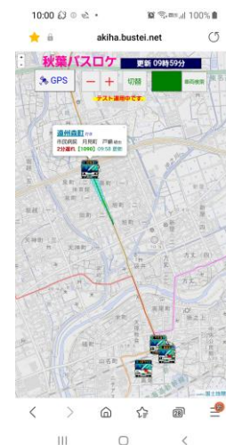
お知らせと秋葉バスロケ画面(スマホ版)