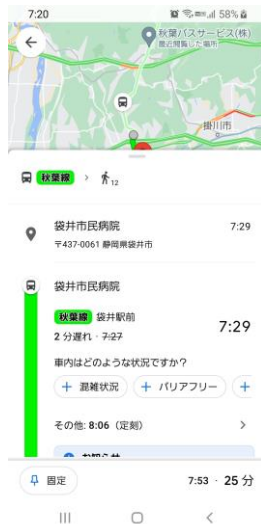
Google マップにおけるリアルタイム情報

*Google における時刻検索や Google マップ上において、遅延情報などリアルタイム情報を発信できる体制を整え、お客様への情報の発信に努めています。