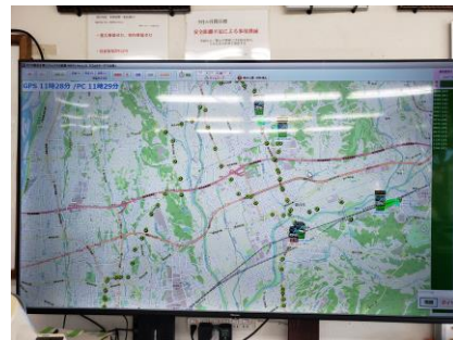
事務所内大型モニター