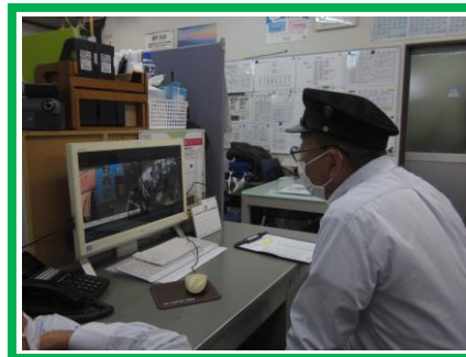
ドライブレコーダー教習