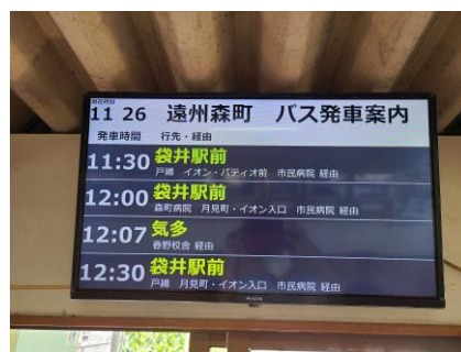
遠州森町バス待合室

*デジタルサイネージを用いてバスの発車案内を表示することで、お客様への情報提供の高度化を図りました。遠州森町バス待合所と JR 袋井駅南北自由通路に設置中です。