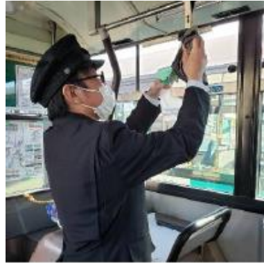
バス車内の消毒作業

※2023年3月13日以降は政府方針に則り、検温、一部座席の封鎖解除など緩和しておりますが、車内の換気、消毒、乗務員のマスク着用は引き続き行っております。