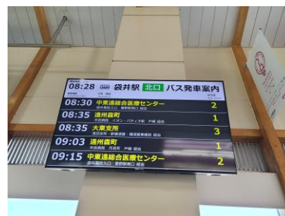
袋井駅南北自由通路