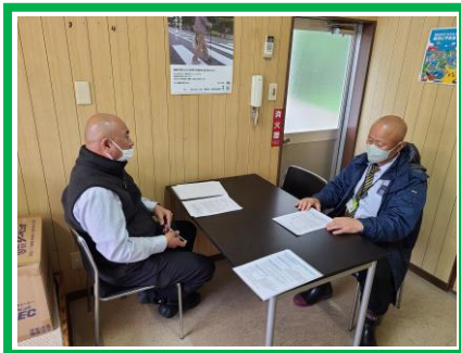
安全統括管理者面談