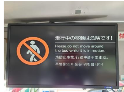
運賃表示器による車内事故防止啓発メッセージ